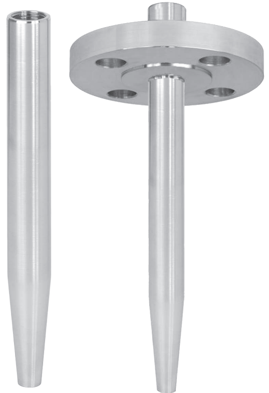
Ilustr. a la izquierda: Vaina para soldar, modelo TW55-6

Ejecución combinadas véase tabla página 3