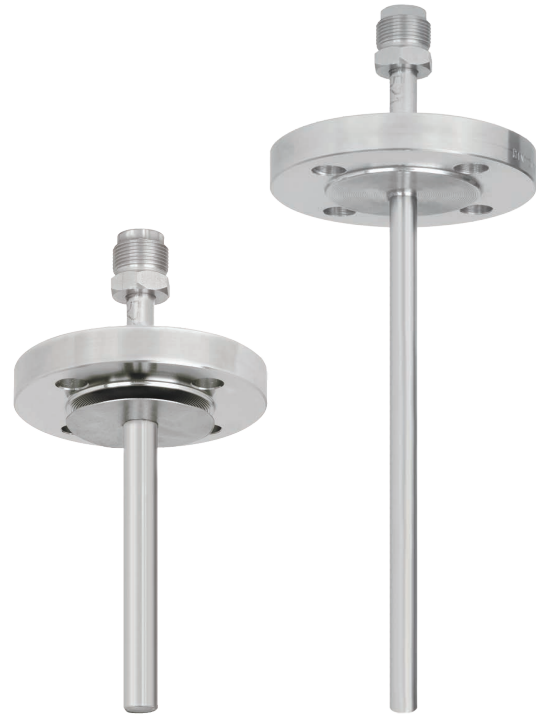
Figure de gauche : doigt de gant avec couvercle en tantale, version TW40-E

De plus, il est possible de différencier les doigts de gant mécano-soudés de ceux massifs. Les doigts de gant mécano-soudés sont usinés à partir d'un tube, qui est fermé à son extrémité par une extrémité mécano-soudée. Les doigts de gant massifs sont usinés à partir d'une barre massive.