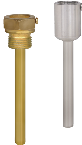
Fig. izquierda: vaina con rosca

Debido al casi ilimitado número de posibles aplicaciones, existen muchas variantes de vainas, como distintos diseños o materiales. El tipo de conexión a proceso y los métodos básicos de producción constituyen un importante criterio de distinción. Se puede distinguir básicamente entre vainas para roscar, para soldar o con conexión de brida. Además, podemos distinguir entre vainas de barra y de tubo.