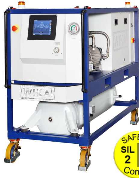
Unidad de servicio SF 6 con depósito de 300 litros