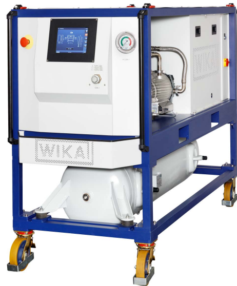
Unidad de servicio SF 6 con depósito de 300 litros