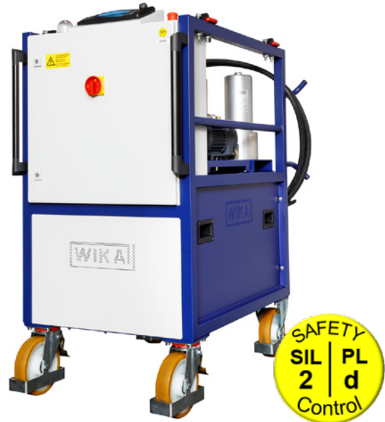
Sistema de desidratação de gás, modelo GAD-2000