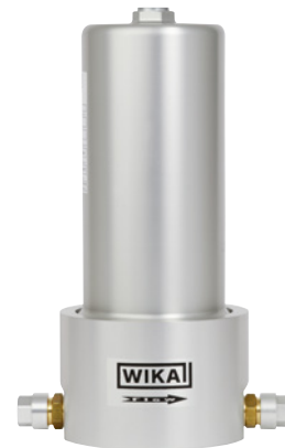
Portable SF 6 -Filtereinheit, Typ GPF-10