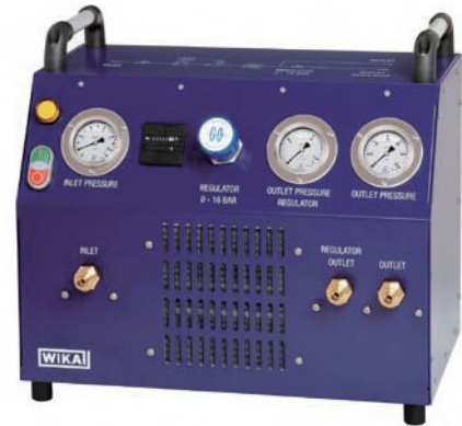
便携式SF 6 气体传输装置，型号GTU-10