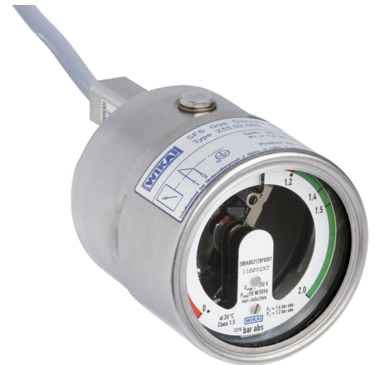
Монитор плотности газа, модель GDM-063

Монитор плотности газа WIKА имеет герметичную конструкцию с термокомпенсацией. Благодаря этому колебания измеренной величины и ложные срабатывания аварийной сигнализации, вызванные либо изменением температуры окружающей среды, либо колебаниями атмосферного давления, исключены.