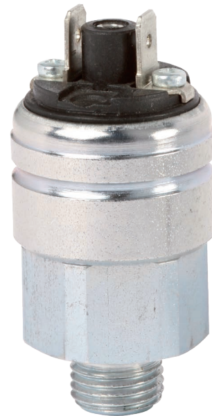
Presostato compacto OEM, versión básica, modelo PSM06