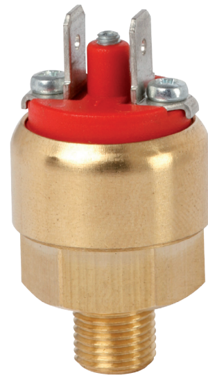
Kompaktowy przełącznik ciśnienia OEM, format miniaturowy, konstrukcja z mosiądzu, model PSM05