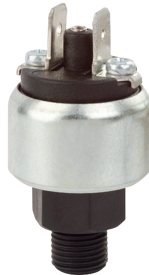
Pressostat compact OEM, format miniature, type PSM04