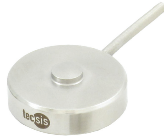
Тензодатчик сжатия, модель F1226

С данным преобразователем силы очень легко работать, устанавливать его тоже относительно несложно. Небольшие размеры позволяют использовать преобразователь для измерения силы сжатия в крайне узких местах с ограниченным монтажным пространством.