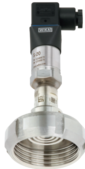
Система мембранных разделителей, модель DSS19T