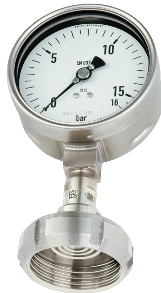
Система мембранных разделителей, модель DSS19F