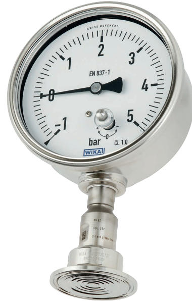
Sistema con separatore a membrana, modello DSS22P