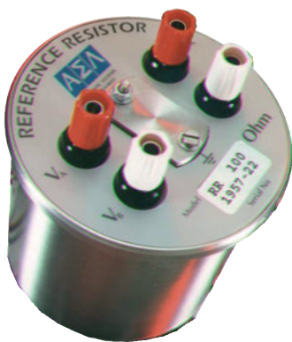
Résistance de référence type CER6000-RR de 100 Ω