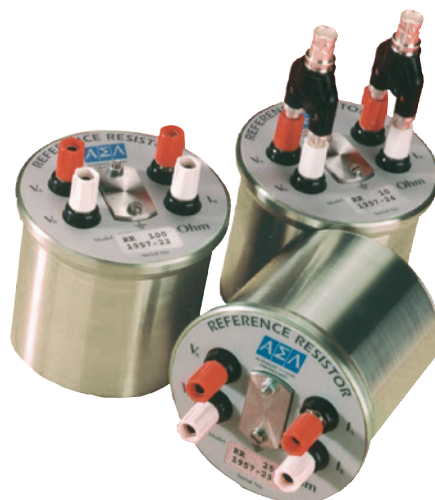
Résistance de référence type CER6000-RR avec différentes étendues de résistance