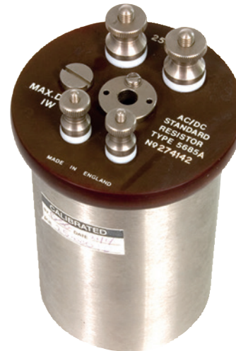
Résistance étalon de référence, type CER6000, 10 \Omega