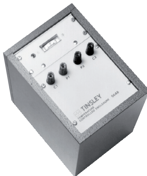
Conteneur thermique pour résistances CER6000-RW à une température fixée à 36 °C [97 °F]