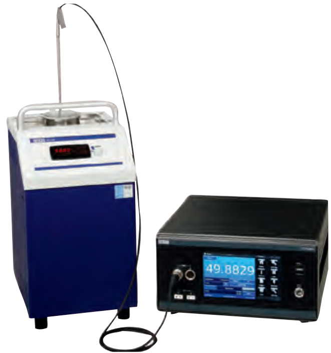
CTB9100型微型恒温油槽，CTR3000型多功能精密测温仪