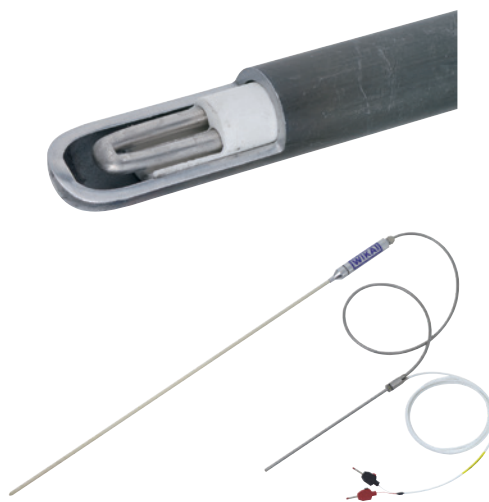
Termopar modelo CTP9000

Durante la medición, debe asegurarse que los cables de compensación que salen del punto de medición al punto de comparación estén fabricados con materiales que tienen las mismas propiedades termoeléctricas en un rango de temperatura limitado. Por eso no se produce ninguna tensión térmica en esta transición. Dicha tensión se forma tan solo allí donde las líneas de compensación están embornadas a conductores normales de cobre.