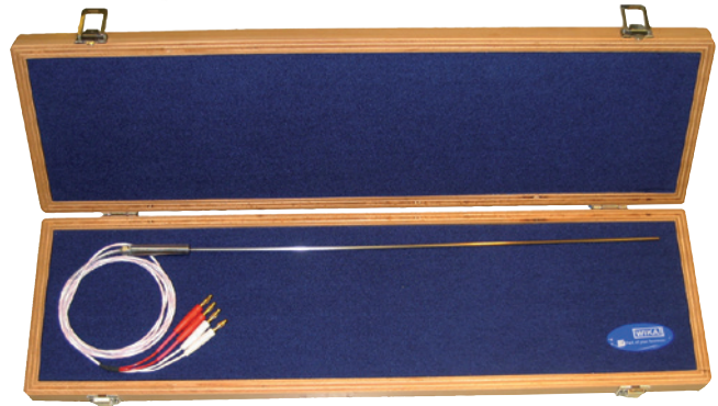
Platin-Widerstandsthermometer Typ CTP2000