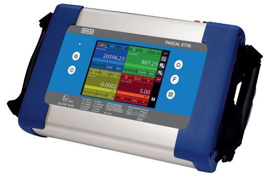
Переносной многофункциональный калибратор, модель Pascal ET/IS

Pascal ET является самым современным переносным многофункциональным калибратором для измерения и моделирования следующих параметров: относительное и абсолютное давление, электрические сигналы (мА, мВ, В, Ом), температура (термопары, термопреобразователи сопротивления), частота и импульсы. Кроме того, опционально прибор может комплектоваться модулем HART®, позволяющий коммуникацию с приборами HART®.